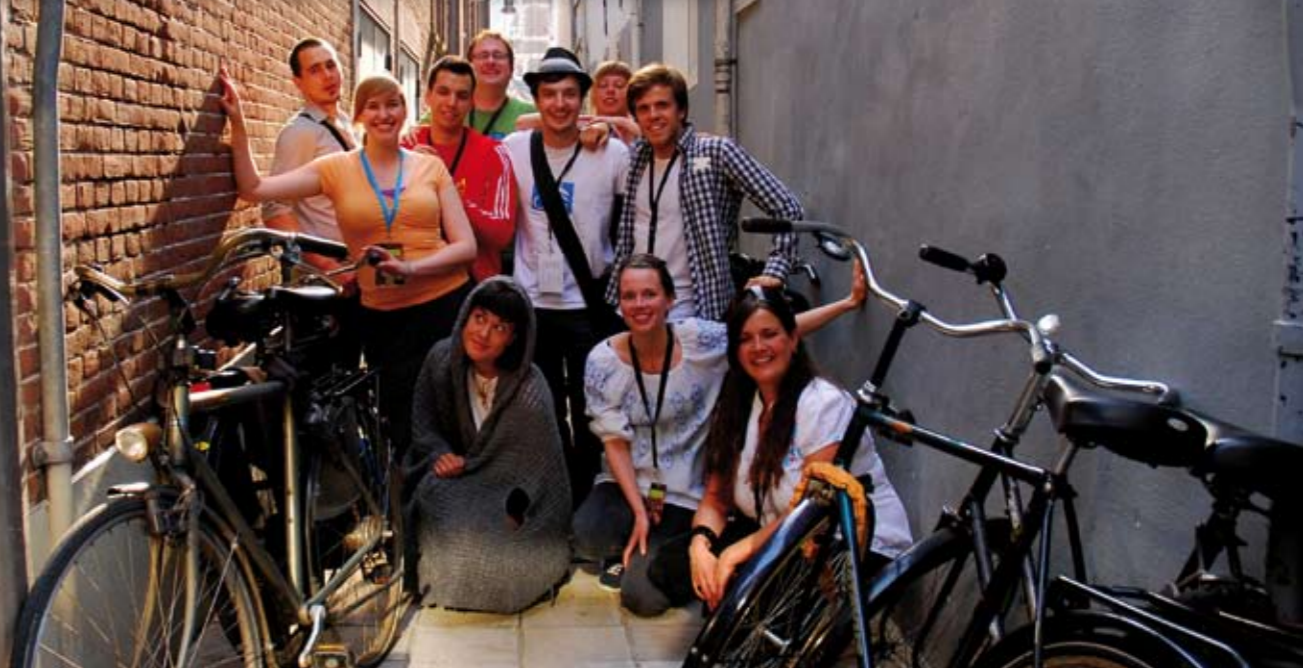
Deelnemers Ensemble Week 2010

Drumming P.A.R.T.S. België The Wish To Be a Red Indian Hogeschool voor de Kunsten Utrecht & Justus Liebig Universität Giessen Duitsland I'll be gone Toneelacademie Maastricht & Manchester Metropolitan University Groot-Brittannië UNTITLED Artesis Hogeschool Vlaanderen --- Prishtina University, Faculty of Arts Kosovo Macbeth Tarbiat Modares University Iran The amnesic days of the polar nights Theatre Faculty of the Janaček Academy of Musique and Performing Arts Tsjechië Die Bakchen Max Reinhardt Seminar Oostenrijk Las Alba Bizkaia Drama School Bilbao Spanje De schaamteclub Artesis Hogeschool Vlaanderen PUIN Erasmus Hogeschool Brussel (RITS) Vlaanderen vom Schlachten des gemästeten Lamms und vom Aufrüsten der Aufrechten Universität Hildesheim Duitsland & Hochschule der Künste Bern Zwitserland Verve 2010 Northern School of Contemporary Dance Groot-Brittannië Classical dance of today Riga Choreography School Letland Wolismilch & 11.21 Palucca Schule Dresden Duitsland